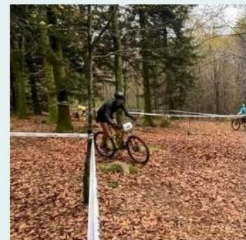
on se retrouve très vite pour le CROSS ...