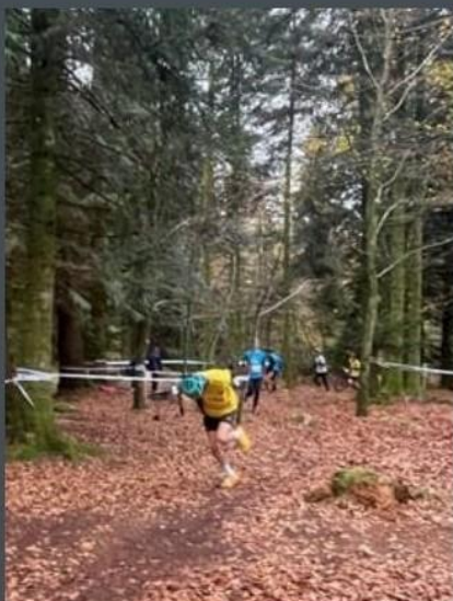
méthode aérobic ( ou plutôt le début d'une chute mais chut! )